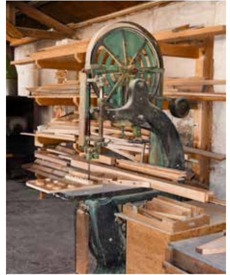
Eine alte Bandsäge zu seinerzeit