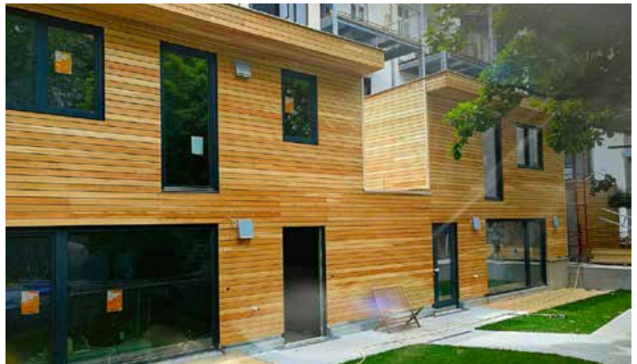
Umsetzung moderner Großprojekte, wie etwa diese Wohnhausanlage in Wien

eine Umsetzung von Großprojekten, wie modernen Dachausbauten, Aufstockungen für exklusive Wohnungen bis Wien und Umgebung möglich machen. Auch gilt man als Spezialist für den Einsatz von modernen Massivholzplatten.