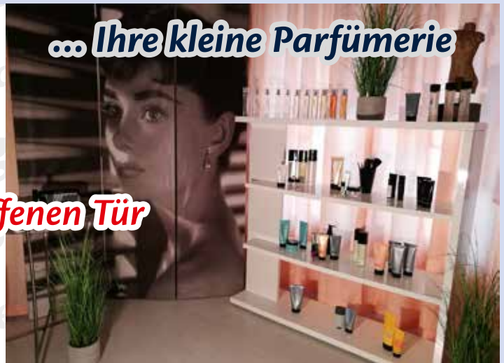
... Ihre kleine Parfümerie

ehemaliges Chinalokal, Zugang hinten über den Innenhof, 1. Türe rechts