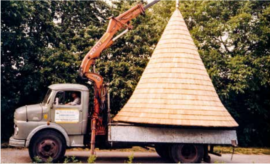
Transport des Daches der Jagdkapelle. Entwurf v. Architekt Clemens Holzmeister